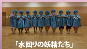
「水回りの妖精たち」

ダンス部 です! 夏合宿を終えて団結した部 員たちは、文化祭に向け、様々なジャンルでの8つ の作品に取り組んでいます。2月には東京都女子 体育連盟主催の大会に参加する予定です!